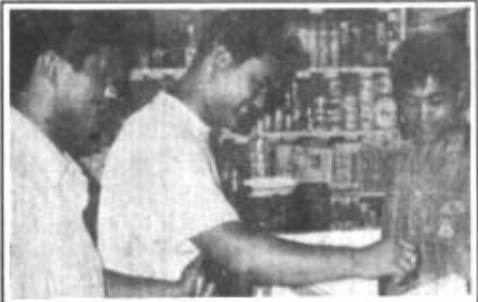
实施卷烟销售“监销制”，是实现烟草垄断经营的一项重大举措。图为河口区烟草专卖局对经销的卷烟加盖监销章。